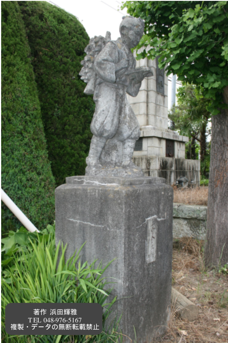
複製・データの無断転載禁止